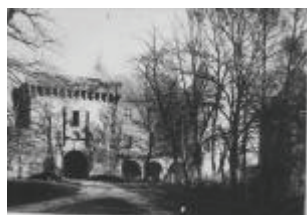
Le château : le châtelet d'entrée