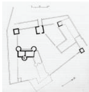
Le château : plan