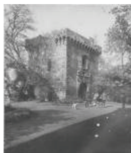
Le château : le châtelet