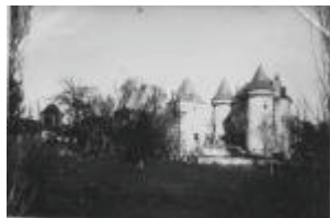
Le château : vue générale