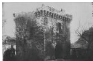
Le château : le châtelet d'entrée vu depuis la cour intérieure