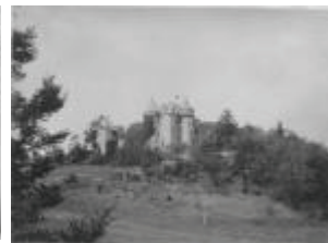
Le château : vue générale