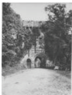
Le château : le