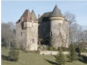
Le château : vue générale depuis l'Ouest

Dominant la vallée de la Masse et un paysage caractéristique de la Bouriane, le château de Montcléra est un des nombreux témoins de la vague de reconstruction qui toucha la Quercy au lendemain de la guerre de Cent Ans . Plus original est le châtelet du 17 e siècle , protégeant l'accès au corps de logis flanqué de tours .