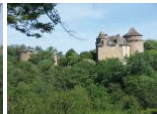
Vue d'ensemble du site depuis le sud-est.