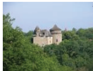
Vue du logis depuis le sud-est.