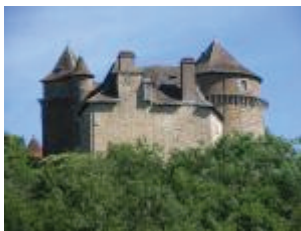
Vue du logis depuis le sud-est.