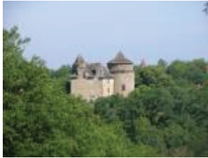
Vue du logis depuis le sud-est.

Le château, bâti au 16e siècle au sommet d'une butte boisée à l'écart du petit bourg de Saignes, s'élève en un corps de logis cantonné de tours autrefois couronnées de mâchicoulis.