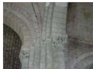
L'église Saint-Genès : pilier sud-est de la croisée du transept orné de chapiteaux