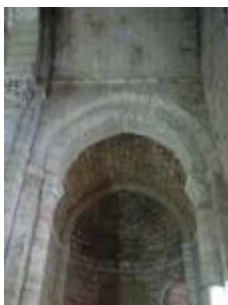
L'église Saint-Genès : l'absidiole sud