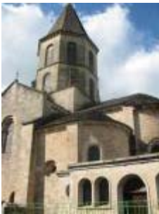
L'église Saint-Genès : le clocher élevé au-dessus de la croisée du transept