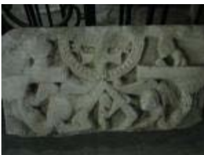
L'église Saint-Genès : fragment d'un tympan roman historié (?)