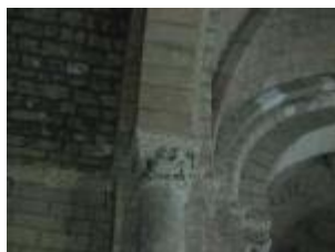
L'église Saint-Genès : chapiteau sur le côté sud de l'arc triomphal du chœur