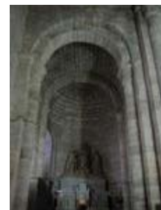
L'église Saint-Genès : l'absidiole nord