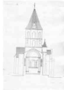
L'église Saint-Genès : coupe transversale