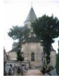
L'église Saint-Genès : vue générale depuis l'Est