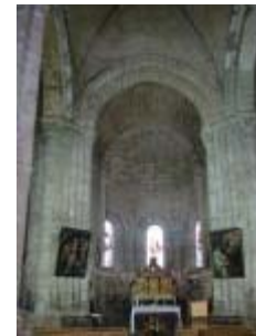
L'église Saint-Genès : le chœur vu depuis la croisée du transept