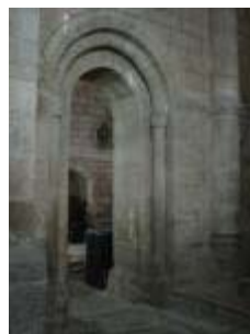
L'église Saint-Genès : passage vers le chœur depuis l'absidiole sud