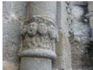
L'église Saint-Genès : chapiteau roman de la fenêtre nord au chevet