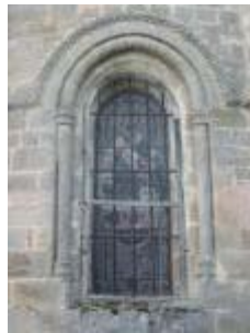
L'église Saint-Genès : la fenêtre de l'absidiole nord