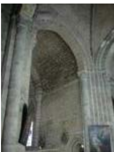
L'église Saint-Genès : l'arc triomphal du chœur