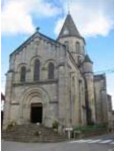
L'église Saint-Genès : vue générale depuis l'Ouest

L'image que donne au premier regard l'église du petit bourg d'Aynac est celle d'un édifice néo-roman du 19 e siècle, imposant et austère. Le chœur relève pourtant d'une remarquable construction romane du 12 e siècle , dans laquelle sont conservés d'étonnants chapiteaux historiés .