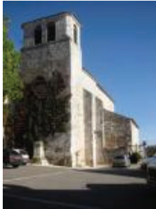
L'église Saint-Jean-Baptiste : vue générale depuis l'Ouest

Construite au 17e siècle à l'emplacement d'un édifice antérieur, l'imposante église de Sérignac se distingue essentiellement par son mobilier de style baroque : deux portails et des tables de communion sculptés, ainsi qu'un retable monumental dédié à saint Jean-Baptiste.