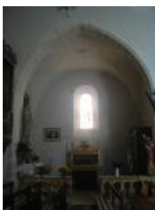
L'église Saint-Jean-Baptiste : la chapelle sud