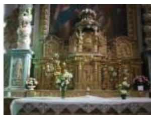
Le retable du maître-autel : le tabernacle