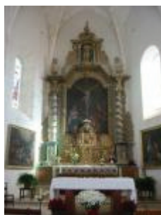
Le retable du maître-autel : le tabernacle