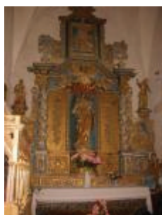
Le retable de la chapelle nord