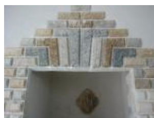
L'église Saint-Jean-Baptiste : la porte à bossages des fonts baptismaux