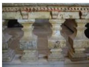
L'église Saint-Jean-Baptiste : table de communion de la chapelle sud