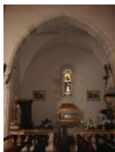
L'église Saint-Jean-Baptiste : la chapelle nord