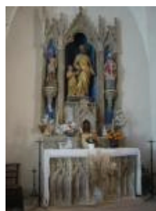
Le retable de la chapelle sud