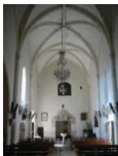
L'église Saint-Jean-Baptiste : la nef vue depuis le chœur