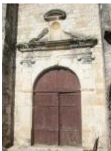
L'église Saint-Jean-Baptiste : le portail sud