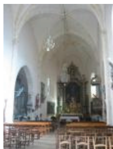
L'église Saint-Jean-Baptiste : vue générale intérieure