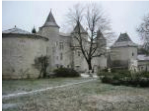
Le château de Charry : vue générale depuis le Sud-Ouest

Situé sur un coteau dominant la vallée du Lendou, le château de Charry fut érigé selon un parti architectural prisé au 15 e siècle : un logis flanqué de tours , représentatif de l'enrichissement de la bourgeoisie locale. Il fut aussi le berceau de Laurent de Charry qui se distingua auprès de Catherine de Médicis pendant les Guerres de Religion.