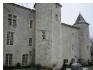
Le château de Charry : la façade principale sud