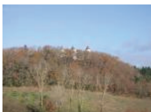
Le château de Charry : vue depuis la vallée du Lendou