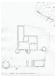
Le château de Charry : plan du rez-de-chaussée