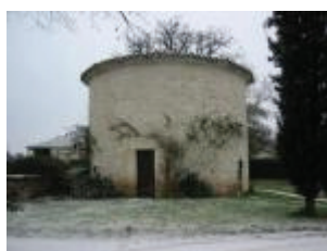
Le château de Charry : la chapelle aménagée au 17e siècle dans une tour circulaire de l'enceinte