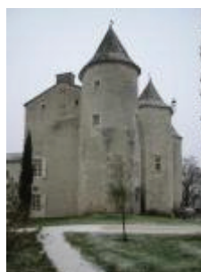
Le château de Charry : vue de l'Ouest