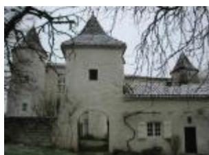
Le château de Charry : la porterie