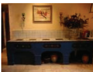
Le château de Charry : "potager" de la cuisine