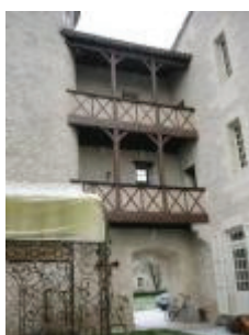
Le château de Charry : la galerie extérieure aménagée au 17e siècle