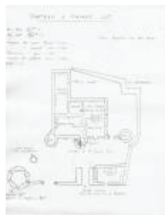
Le château de Charry : plan du rez-de-chaussée avec annotations