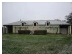
Le château de Charry : les écuries du 18e siècle