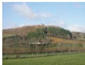
Le château de Charry : vue depuis la vallée du Lendou